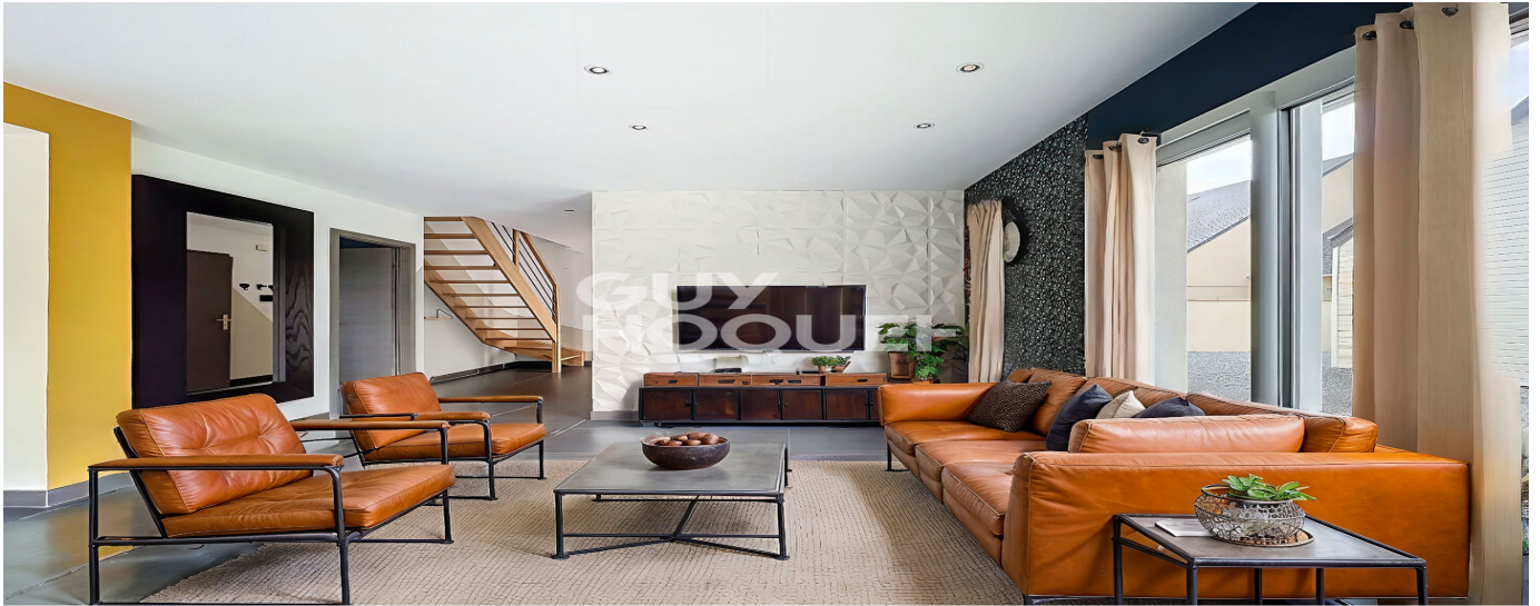
Projection virtuelle non contractuelle proposée par IACrea