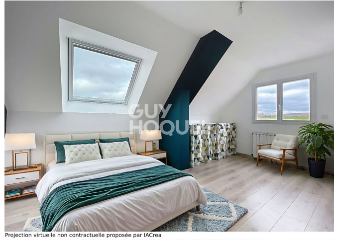
Projection virtuelle non contractuelle proposée par IACrea