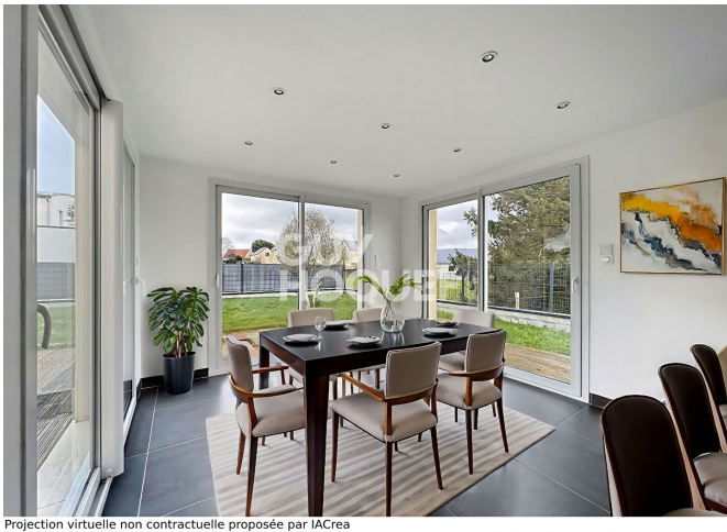
Projection virtuelle non contractuelle proposée par IACrea